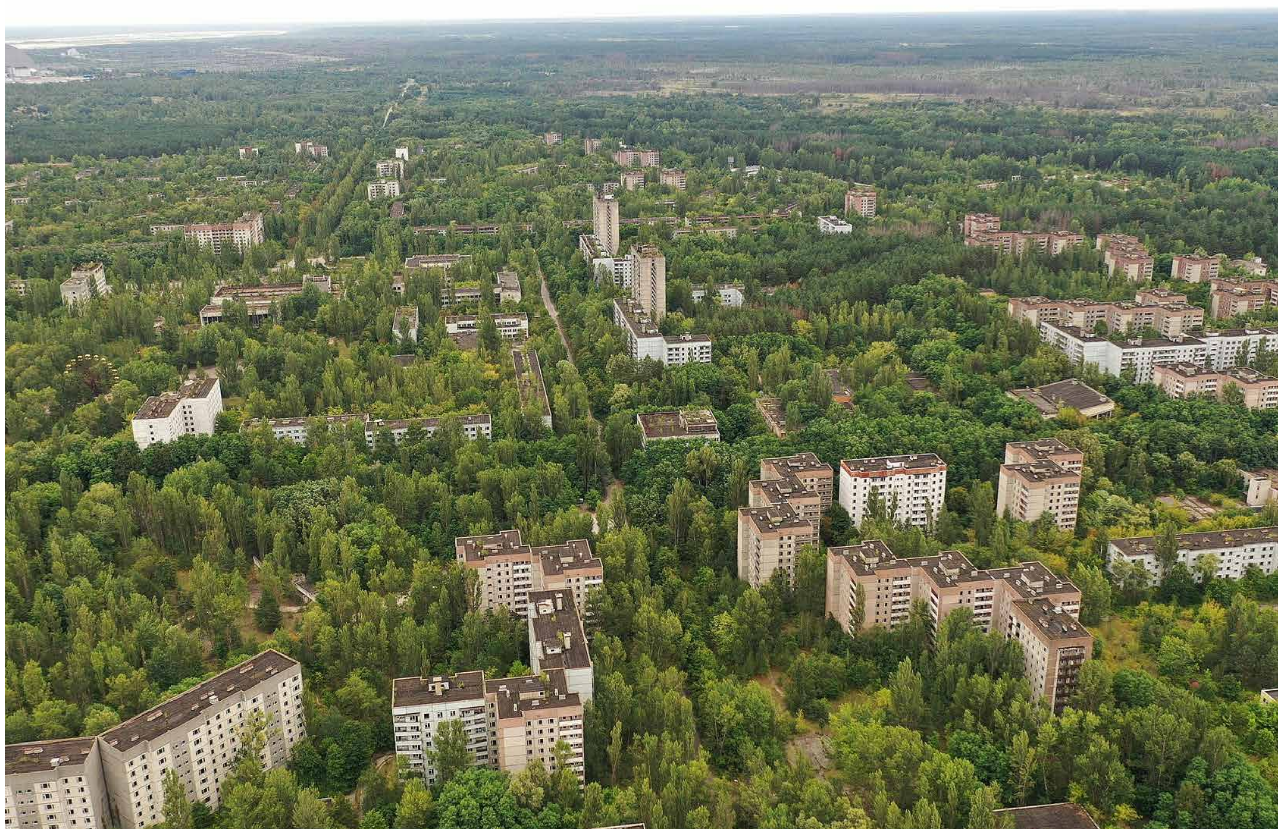
نمایی از شهر پریپیات؛ قبل از فاجعه‌ی هسته‌ای چرنوبیل